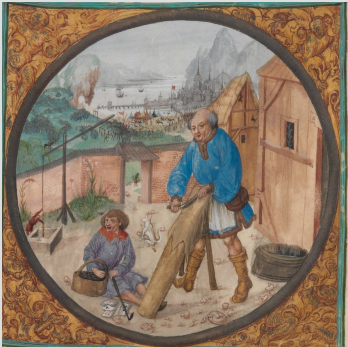
Krakowski garbarz przy swojej pracy