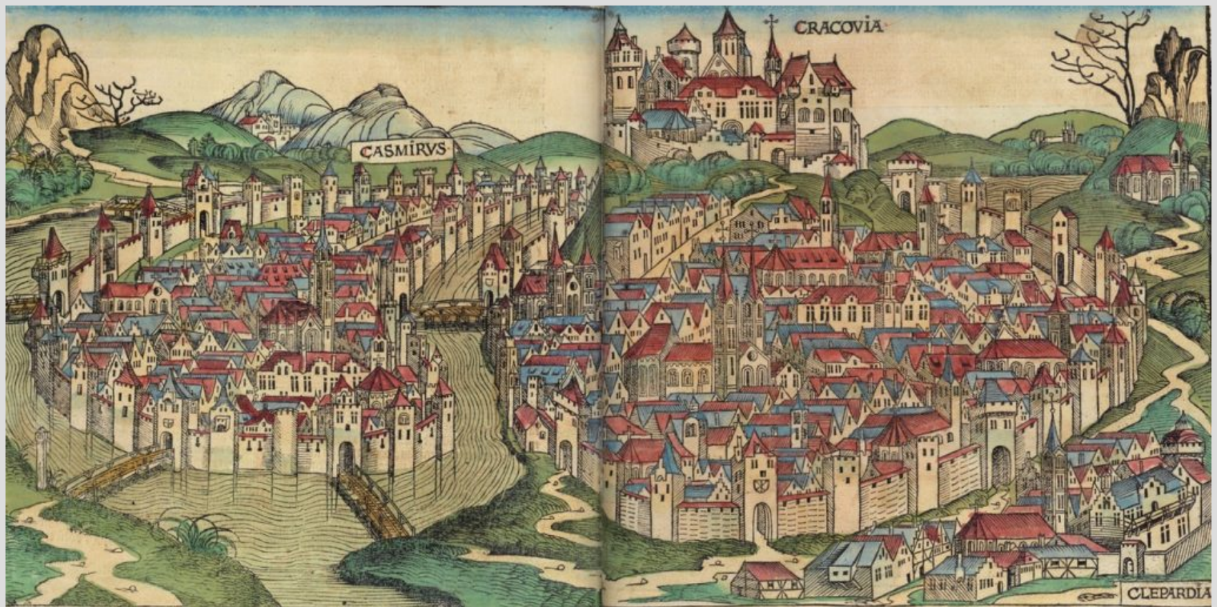
Grafika z Kroniki świata Hartmanna Schedela z 1493 roku